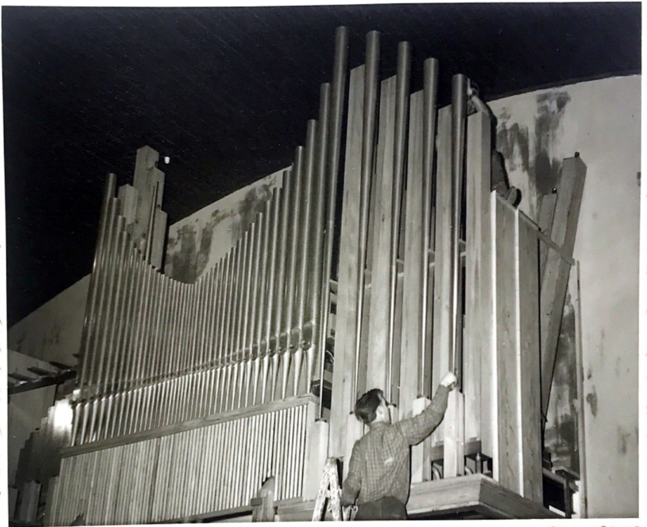
Hauptwerk und Pedal des Orgelprospektes