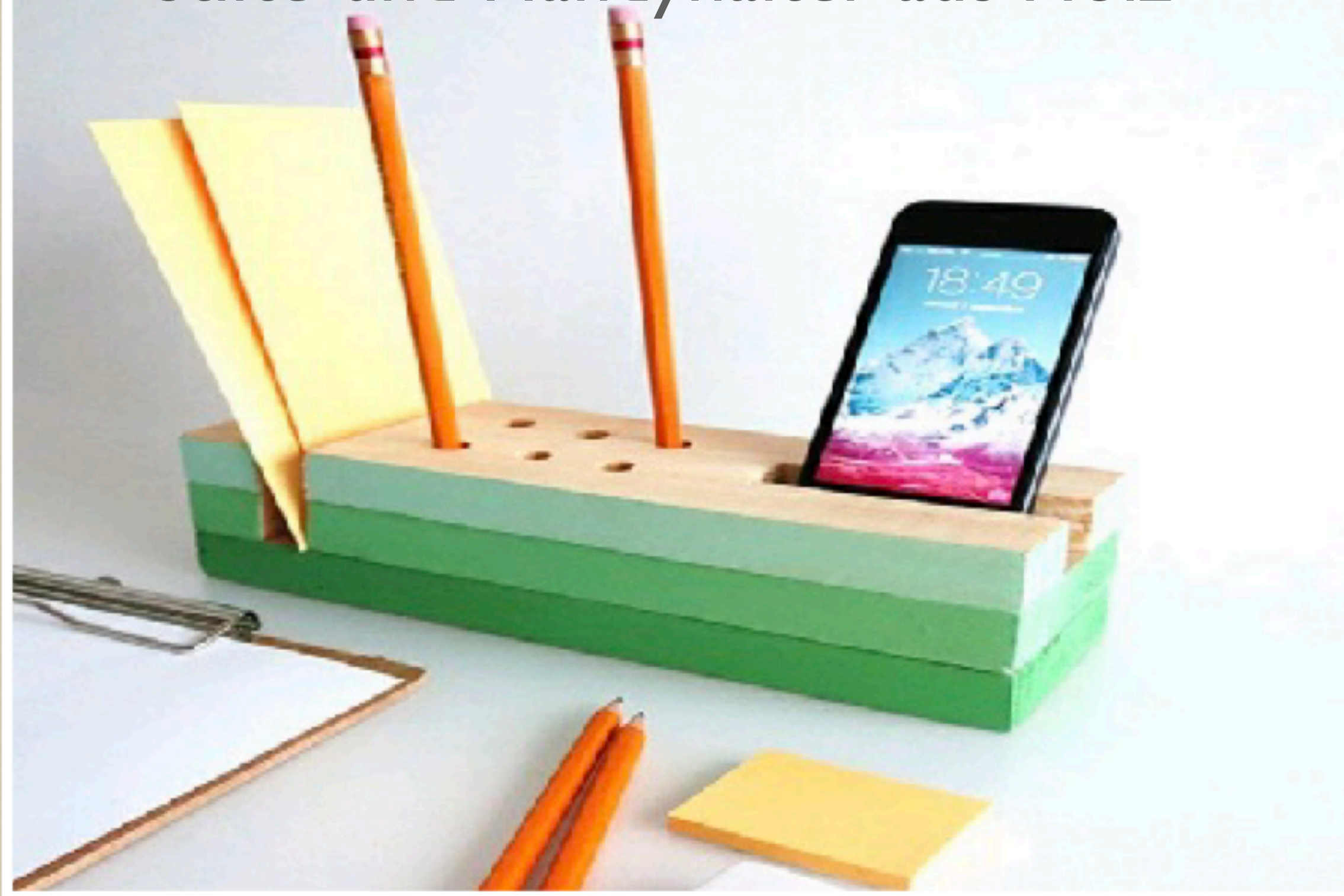
Stifte-und Handyhalter aus Holz